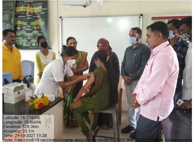
Latitude: 18.274206 Longitude: 75.466957 Elevation: 529.36m Accuracy: 20.1m Time: 29-10-2021 11:28 Note: Free covid-19 vaccination camp program for students, NSS dept, S.G.R.G. Shinde College, paranda