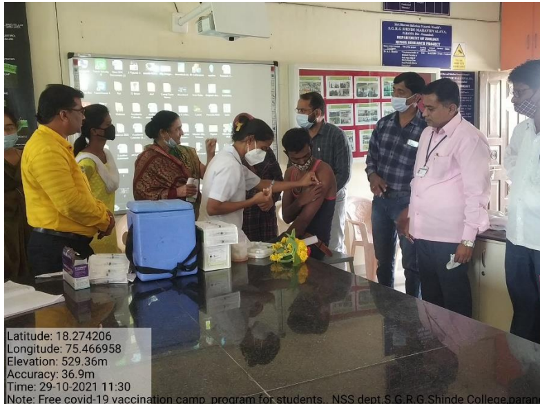
Latitude: 18.274206 Longitude: 75.466958 Elevation: 529.36m Accuracy: 36.9m Time: 29-10-2021 11:30 Note: Free covid-19 vaccination camp program for students, NSS dept, S.G.R.G. Shinde College, paranda