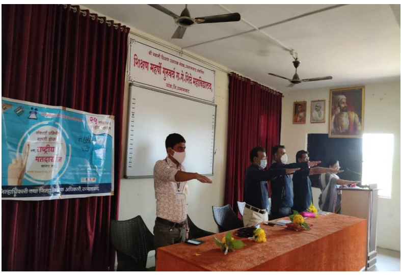
NSS and Cultural Department National Voters Day 25/01/22 12:20 9233322930 4096 11100 HQAC FFB+JRC, Paranda, Maharashtra 413502, India