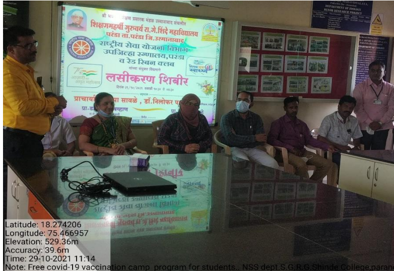
Latitude: 18.274206 Longitude: 75.466957 Elevation: 529.36m Accuracy: 39.6m Time: 29-10-2021 11:14 Note: Free covid-19 vaccination camp program for students, NSS dept, S.G.R.G. Shinde College, paranda

Covid-19 vaccination camp and awareness program was organized by the college in collaboration with District Sub-hospital Paranda and Red Ribbon Club Paranda on 29 th October 2021.